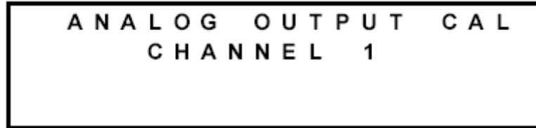
图 16 选择校准通道

图 16 显示的是一旦从输入/输出 (I/O) 校准界面选择了输出校准 (OUTPUT CAL) 后第一次显示的界面。这个界面选择要校准的输出通道。要获得校准输出的更多信息，参阅本手册中的维护部分。